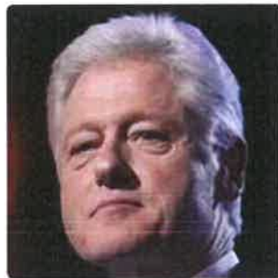
K. Naam Bill Clinton