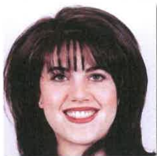
E. Naam Monica Lewinsky