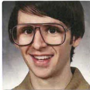
G. Naam Onbekende