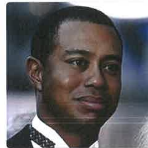
L. Naam Tiger Woods