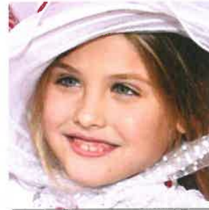
H. Naam Dannielynn Birkhead